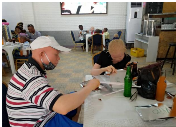
Le partage de repas entre les enfants et leurs encadreurs.